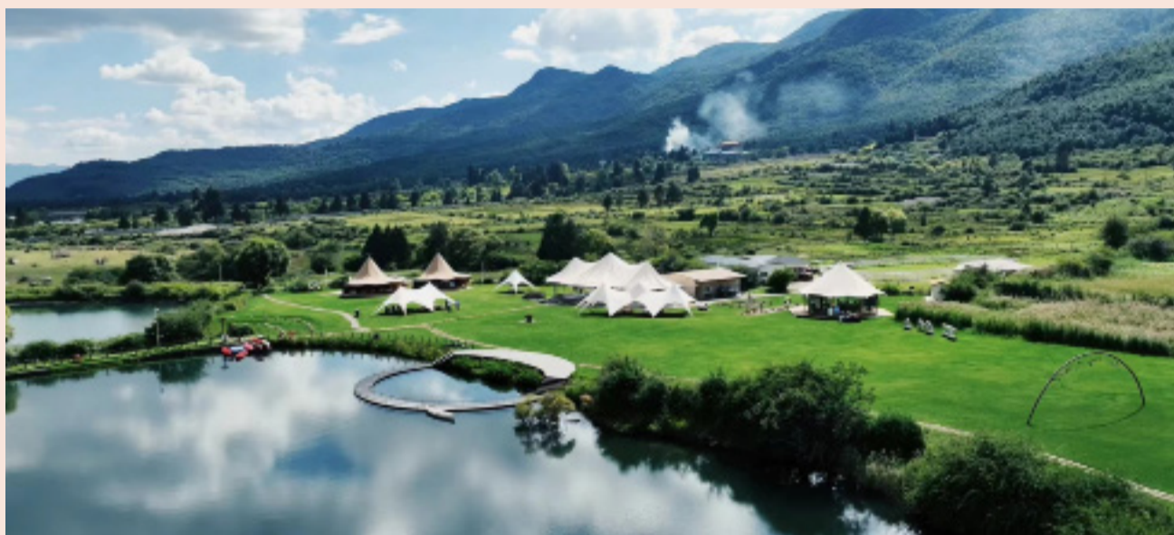
丽江地中海国际度假区 阿美泽雪山营地

复星自创立以来始终秉承“修身、齐家、立业、助天下”的核心价值观,不断加强ESG体系建设和投入。复星已建立完善的ESG管治架构及管理体系,将可持续发展理念融入到每个运营层面,并积极响应国家战略、保障信息安全、促进科技创新、参与公益慈善、保障员工权益,助力可持续管理与价值创造。此外,复星已