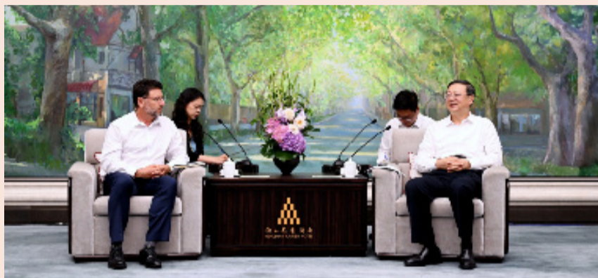
陈吉宁会见美国直观医疗公司全球首席执行官盖瑞·古萨特。