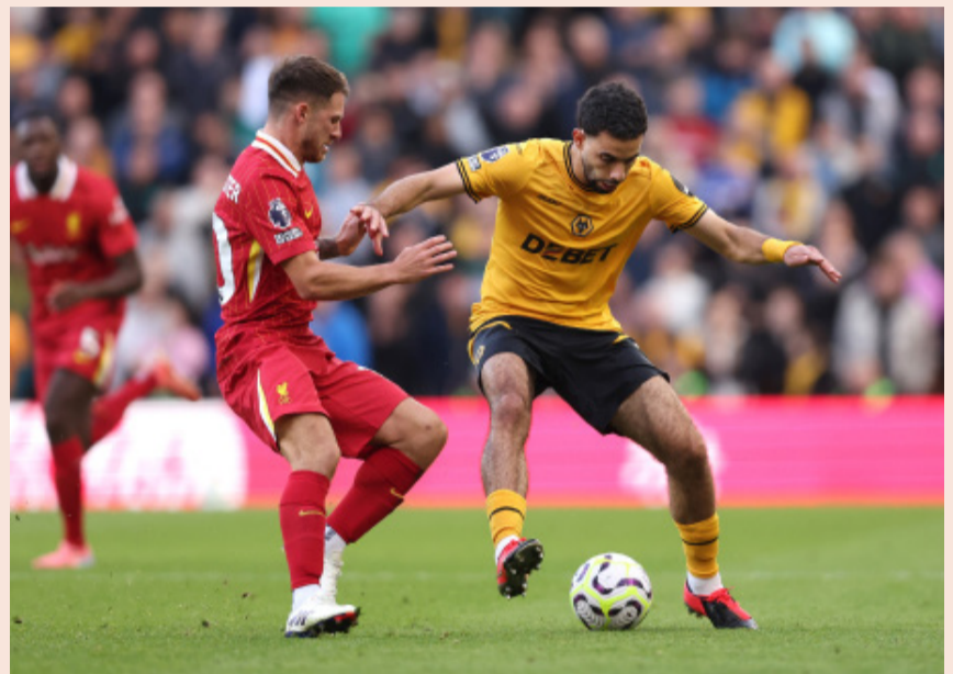
24/25赛季英超联赛第6轮，狼队主场迎战利物浦队

当狼队球员在绿茵场激情挥汗时，赛博空间正展现出体育竞技的另一种魅力。8月，在EWC电竞世界杯上，狼队电竞及其选手在云顶之弈和王者荣耀这两个项目中夺得冠军。