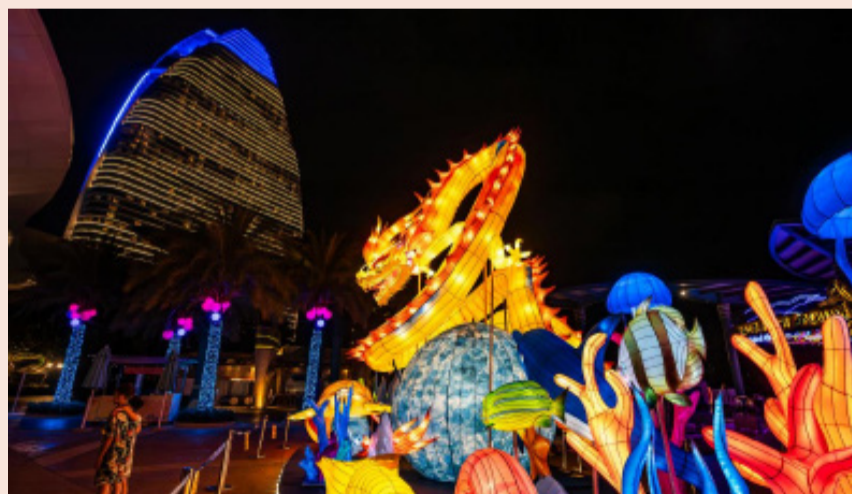
复星旅文旗下三亚·亚特兰蒂斯

对于复星旅文而言，这笔交易则有着多重价值。一方面，出售Thomas Cook UK为复星旅文带来了不超过770万英镑的利润贡献。另一方面，也更为重要的是，剥离与自身战略关联性较低、不符合自身竞争优